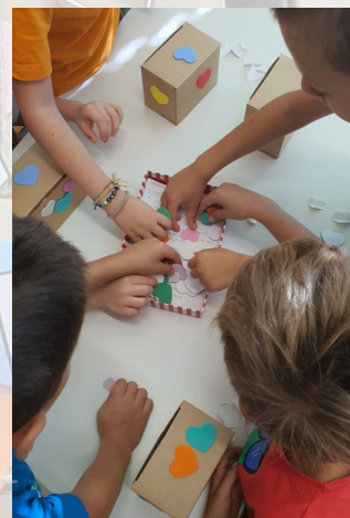
Decoriamo le scatole

All'interno della scatola cuori punteggiati, disegni...e dolci pensieri